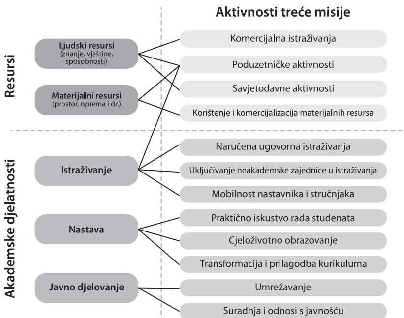
Slika 1. Konceptualni okvir za analizu aktivnosti treće misije (Molas-Gallart i sur., 2002)

Konceptualni okvir kojeg su razvili polazi od ideje da je suradnja sveučilišta s vanjskim okruženjem ono što čini bit treće misije. Sveučilišni ljudski i materijalni resursi, kao i temeljne akademske djelatnosti, mogu stoga doprinijeti snažnijoj interakciji sveučilišta s vanjskim okruženjem, razvojem različitih profitnih i neprofitnih suradničkih odnosa i aktivnosti. Razvijeno je dvanaest područja aktivnosti treće misije, a sveučilišnim resursima i akademskim djelatnostima pridružene su one korespondirajuće. Iako autori zagovaraju jednako uvažavanje obiju, ekonomske i društvene dimenzije treće misije, primjećuje se da je većina aktivnosti treće misije ipak usmjerena komercijalnim sadržajima te stjecanju dodatnih financijskih sredstava.