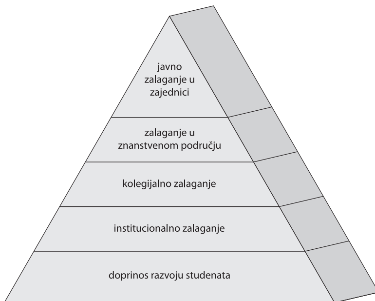
Slika 2. Piramida zajednica i pripadajućih aktivnosti javnog djelovanja (Macfarlane, 2007)

Suradnja sveučilišnih nastavnika sa studentima čini temelj piramide, ujedno dakle i njezino dno, predstavljajući najmanje cijenjeno područje djelovanja sveučilišnih nastavnika, a koje nerijetko oduzima najveći udio vremena u svakodnevnim nastavnim aktivnostima. Ovaj vid djelovanja uključuje široki spektar odgovornosti sveučilišnih nastavnika povezanih s akademskim i osobnim razvojem studenata. Iako je ispravno odijeliti stručnu akademsku podršku od brige za osobni razvoj studenata, Macfarlane (2007) podsjeća da se u svakodnevnom radu nastavnika ove odgovornosti i aktivnosti često isprepliću. Uglavnom uključuju aktivnosti kojima se iskazuje briga za studente, a koje su još uvijek “nevidljive” u sustavima vrednovanja rada sveučilišnih nastavnika i njihova napredovanja.